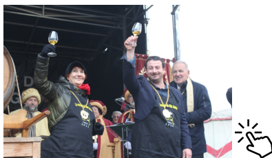
Article : Le Jura Agricole 07.02

A Voiteur, les samedi 4 et dimanche 5 février, la vraie star, c'était lui : le Vin Jaune. Après 6 ans et 3 mois d'élevage en fûts de chêne, le millésime 2016 a été mis en perce. Vingt-quatre mille personnes avaient fait le déplacement pour découvrir, goûter et déguster l'or jaune du Jura dans une atmosphère de fête bon-enfant.