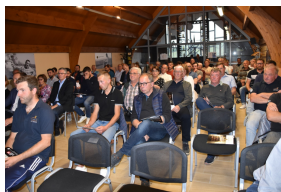
Article :Exploitant Agricole 14.05