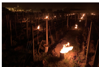
Article : Vitisphere 13.05