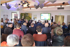
Article Exploitant Agricole 11.05

Le 24 mars dernier à Buxy la FCCBJ, à l'occasion de son assemblée générale, avait invité ses homologues du Vaucluse, la Safer Bourgogne Franche-Comté, la cave du Beaujolais, Agamy et le président du conseil coopératif Ardèche Vignobles, à venir expliquer et témoigner de leurs travaux et pratiques autour du foncier, pour notamment faciliter l'installation de futurs vignerons coopérateurs.