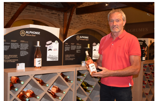
Article Exploitant Agricole 20.05