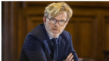
Article : Vitisphere 20.05