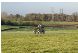
Article : Réussir Vigne 11.05